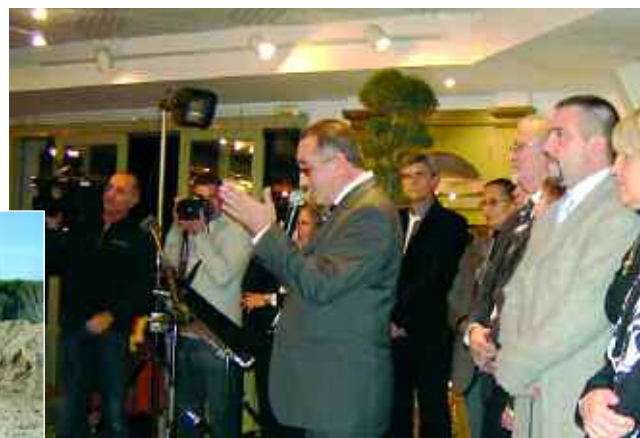
11 janvier. Vœux du Maire