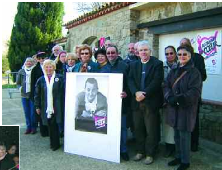
17 décembre. Inauguration de l'antenne des Restos du Cœur de Grimaud