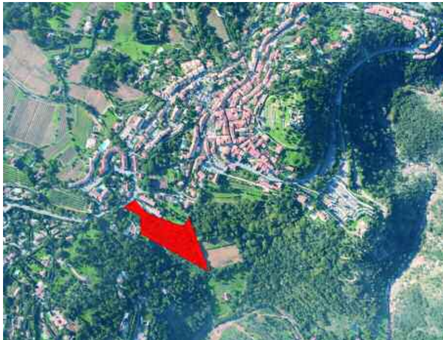
Parc de logements locatifs quartier Saint-Roch