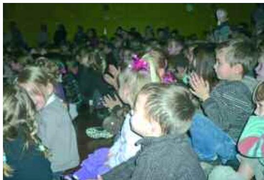
17 décembre. Noël des enfants