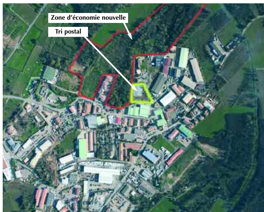
Zone d'économie nouvelle du Grand Pont et tri postal

Certains aménagements se font en partenariat avec les propriétaires privés, la commune assurant la maîtrise d'ouvrage déléguée : raccordement des hameaux des Crottes et Cadéous, projets pour les lotissements du Cros d'Entassi, de la Colline, de Beauvallon et Beauvallon Bartole. En outre la commune a entrepris la réfection des réseaux du centre ancien et prévoit la création de deux ouvrages d'épuration au Val de Gilly et à la Tourre.