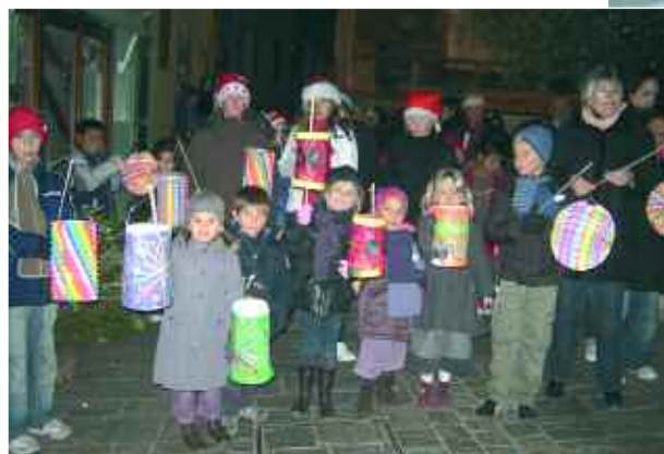
18 décembre. Fête de la lumière