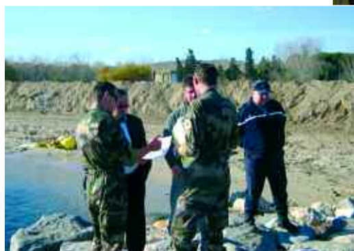
Novembre 2009 Opération de démontage sur la plage de Saint-Pons