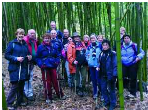
Randonnée du 16 janvier

Merci de vos réponses. Questionnaire à retourner en mairie, cabinet du maire.